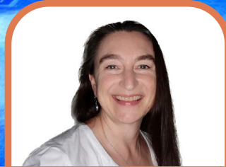
ACCOMPAGNÉ PAR NABHANŪ DU STUDIO MOUVANCE

VOYAGE DE YOGA AVEC OPTION MASSAGE ET PLONGÉE 13 AU 20 OCTOBRE 2023